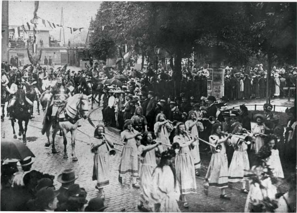
Stadtarchiv Detmold, Bildarchiv Nr. 1337