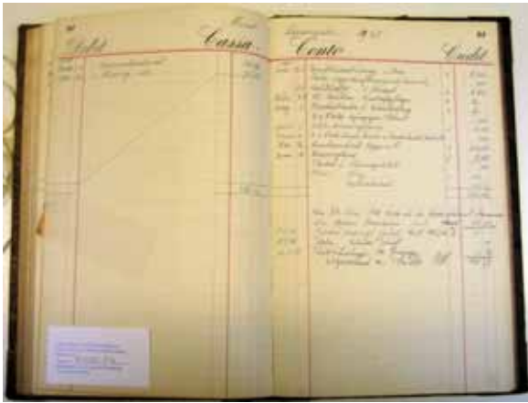
Kassenbuch der Synagogengemeinde Oerlinghausen (1866-1938), letzte Einträge für 1938. (ZA B. 1/34 Nr. 972)