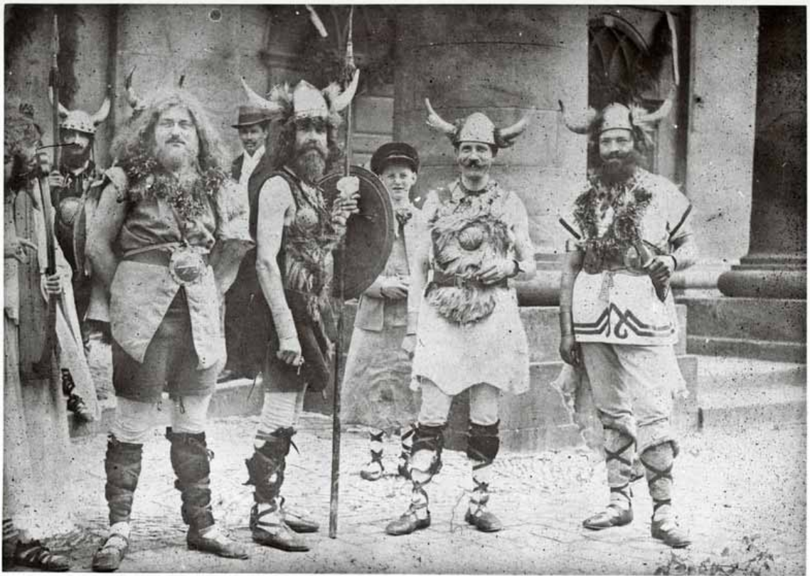
Stadtarchiv Detmold, Bildarchiv Nr. 1345